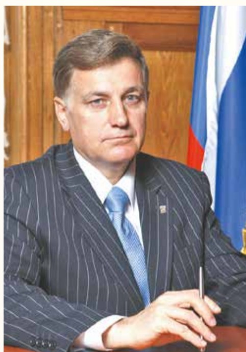
Председатель Законодательного Собрания Санкт-Петербурга, Секретарь Санкт-Петербургского регионального отделения партии «Единая Россия» В.С. МАКАРОВ